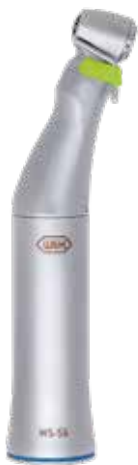
WS-56 1:1 10.600,- 13.300,-