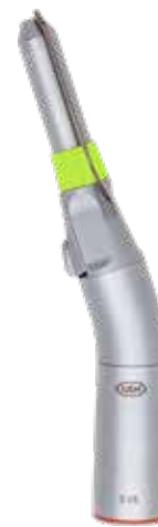
S-16 1:2 13.400,- 16.810,-