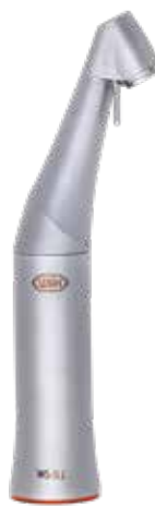
WS-91 1:2,7 11.700,- 14.700,-