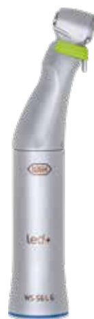
WS-56 LG 1:1 12.900,- 16.250,-