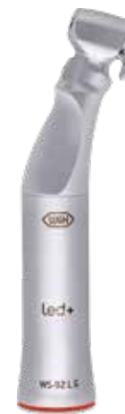
WS-92 LG 1:2,7 12.900,- 16.250,-