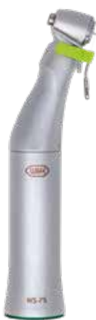
WS-75 20:1 12.300,- 15.460,-