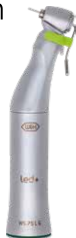
WS-75 LG 20:1 14.500,- 18.230,-