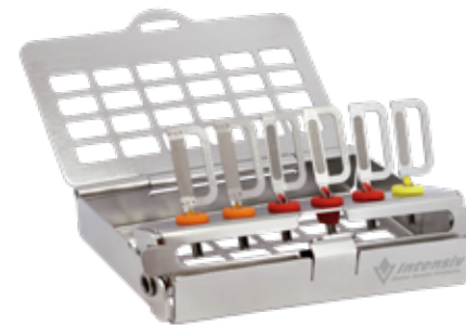
Set 03 Kassett med 6 st ortho strips