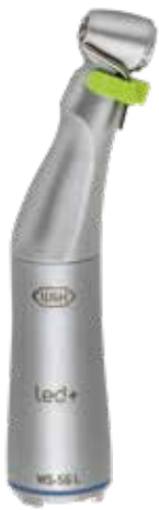
WS-56 L 1:1