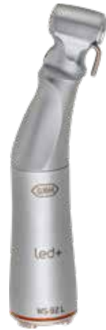
WS-92 L 1:2,7