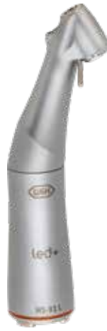
WS-91 L 1:2,7