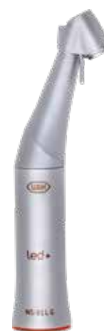
WS-91 LG 1:2,7 12.900,- 16.250,-