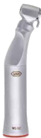
WS-92 1:2,7 11.600,- 14.560,-