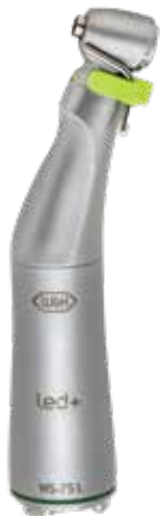
WS-75 L 20:1

*till motor EM-19 LC och Implantmed SI-1023